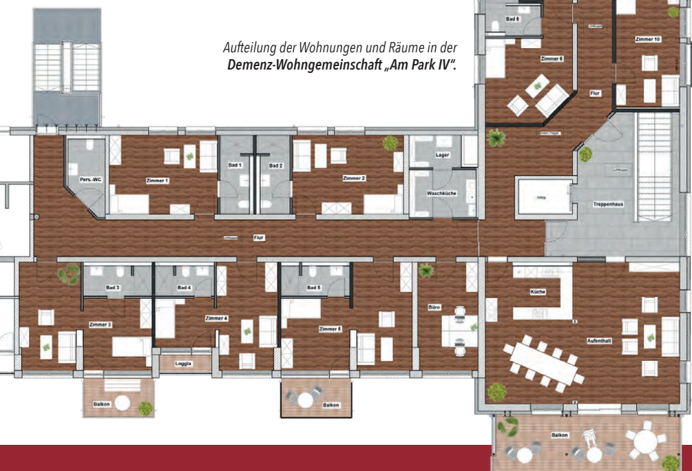
Aufteilung der Wohnungen und Räume in der Demenz-Wohngemeinschaft „Am Park IV“.

In den südlichen Zimmern hat man einen wunderbaren Ausblick über den Lindlarer Freizeitpark mit Schloss Heiligenhoven in die Bergische Landschaft.