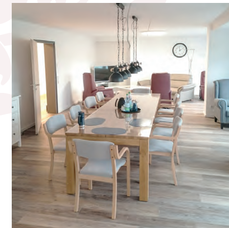
Großes und geräumiges Gemeinschaftswohnzimmer mit offener Küche (nicht im Bild) in der Wohngemeinschaft „Am Park“.